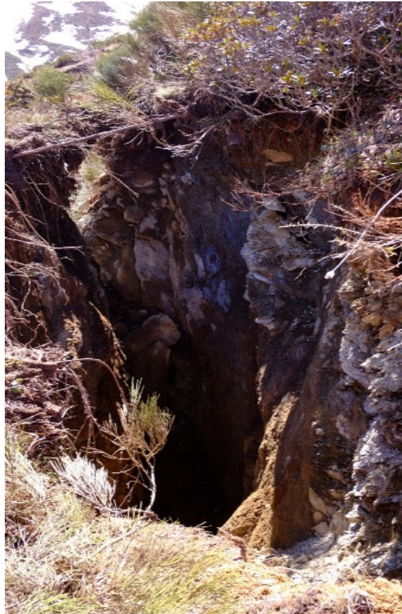
29 avril à 13h15 : + 25cm