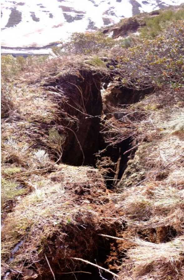
26 avril à 11h45

La fracture entre l'éperon rocheux instable d'environ 3000 m 3 et la partie stable du terrain continue à s'ouvrir. Son évolution varie selon les conditions météorologiques (précipitations, températures).