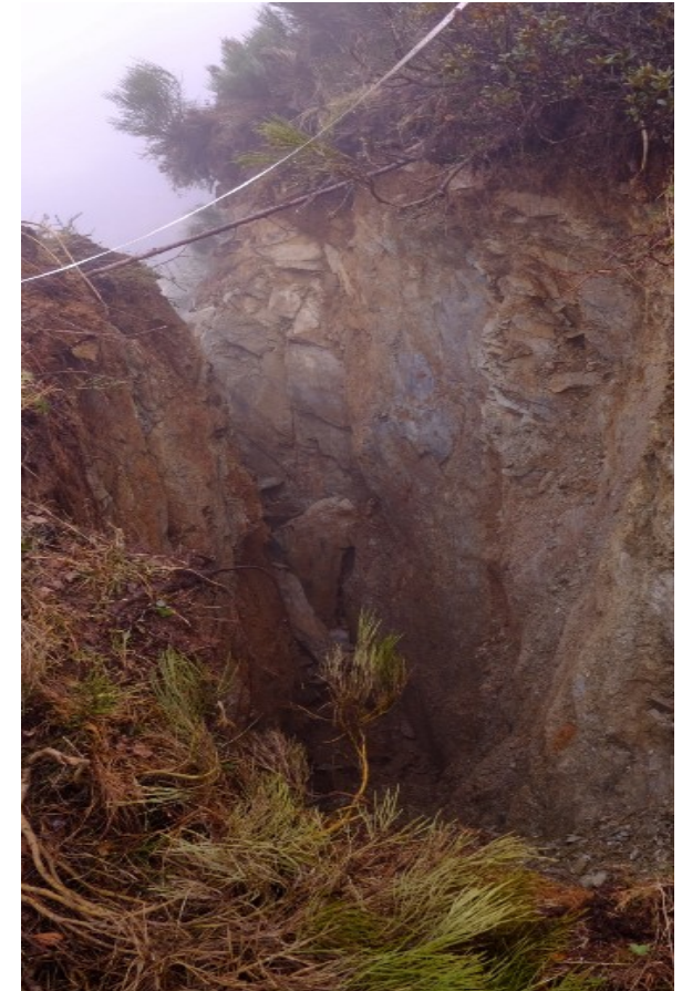
2 mai à 13h26 : + 43cm